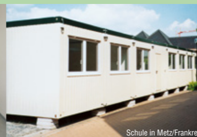
Schule in Metz/Frankreich