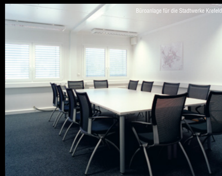
Büroanlage für die Stadtwerke Krefeld

(Im Falle einer Isolierung über 120 mm hinaus ändert sich die Außenhöhe der Elemente!)