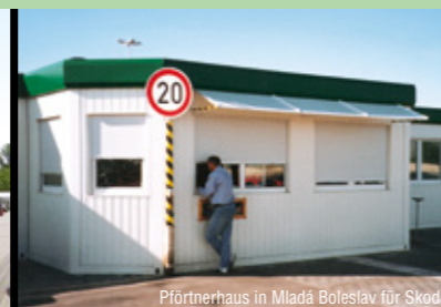
Pförtnerhaus in Mladá Boleslav für Skoda