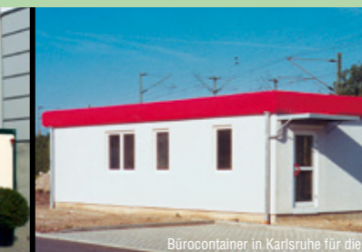
Bürocontainer in Karlsruhe für die DB