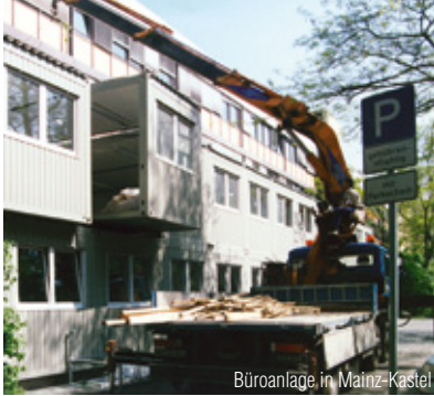
Büroanlage in Mainz-Kastel