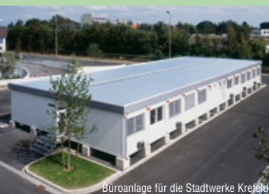
Büroanlage für die Stadtwerke Krefeld

„Sprechen Sie uns an. Unsere Mitarbeiter beraten Sie gerne und ausführlich in einem persönlichen Gespräch.“