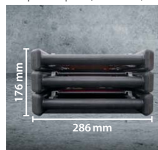
Platzsparend stapelbar (Frontansicht)