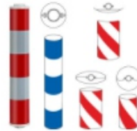
Fahrbahntrenner & Leitzylinder