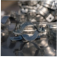
Schilder- und Verkehrszeichenschellen, Edelstahlband & Zubehör