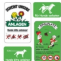
Spielplatz- & Anlagenschilder