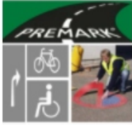
Thermoplastische Markierung Premark