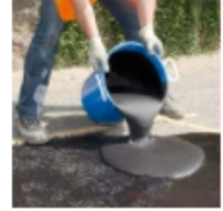
Bodenreparatur, Fugenreparatur, Asphalt