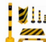
Anfahrtschutz & Rammschutz gelb/schwarz