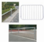
Absperrbarrieren & Geländer