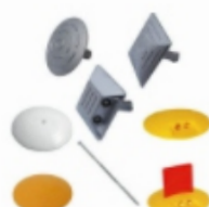
Markierungsnägel aus Aluminium & Kunststoff