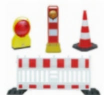
Baustellensicherung, Absperrmaterial, Leuchten, Warnmarkierung