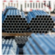
Rohrpfosten aus Stahl & Aluminium, Gabelpfosten