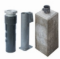
Bodenhülsen, Gabelschlüssel, Schilderfundamente