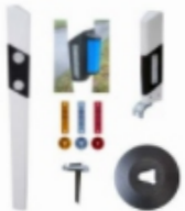
Leitpfosten & Zubehör