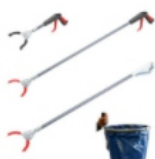
Greifboy-Zangen & Beutelboy