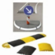
Verkehrsberuhigung, Bodenschwellen, Kölner Teller, Berliner Kissen