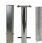
Bodenröhren für Absperrpfosten