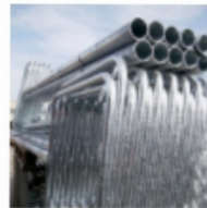
Rohrrahmen & Halterungen für Parkplatzschilder