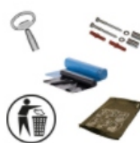
Befestigungstechnik & Zubehör