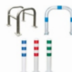
Baumschutzbügel & Schutzpoller