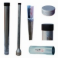
Rohrverlängerungen & Ausleger