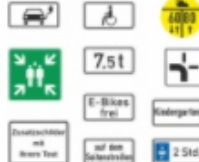
Zusatzzeichen & Sonderschilder 1000-BR5