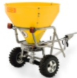
Streuwagen, Kastenstreuer, Anbaustreuer