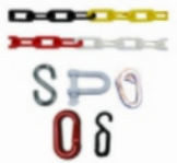
Stahlketten & Kunststoffketten