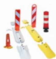
Leitschwellen, Leitelement, Leitboy, flexible Leitpoller