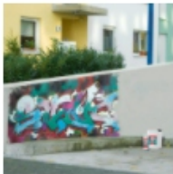
Graffiti-Entferner & Etiketten-Entferner