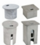
Abdeckkappen für Bodenröhren