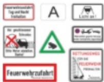
Warn- & Hinweisschilder