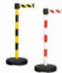
Gurtständer, Wandgurte & Absperrgurte