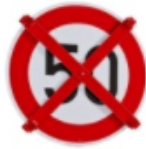
Schilderabdeckband, Auskreuzvorrichtungen für Verkehrszeichen und Wegweiser