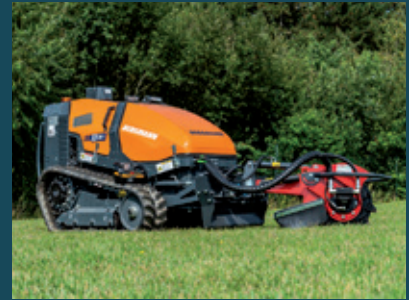
M201 mit Stubbenfräse

Weitere Anbaugeräte: Wildkrautbürste, Schneefräse, Doppelmesserbalken und viele mehr.