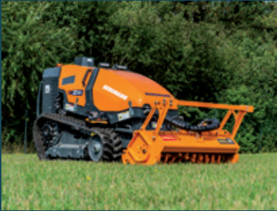
M201 mit Forstmulcher

Unsere Funkraupe kann in den unterschiedlichsten Bereichen der kommunalen Landschaftspflege und bei Forstarbeiten eingesetzt werden. Möglich ist dies dank der verschiedenen Anbaugeräte, die externe Premiumhersteller speziell für die Bergmann M201 entwickeln. Der Clou: Die Funkraupe kann somit das ganze Jahr über ausgelastet werden.