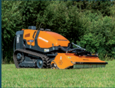
M201 mit Schlegelmulcher