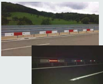
Kurvenleitprofil mit Reflektor