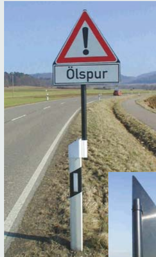
Klappschild (eckig) aus Spezialkunststoff