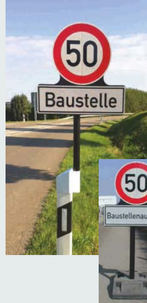
Klappschild (rund) aus Spezialkunststoff