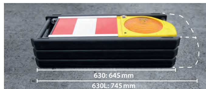
Platzsparend stapelbar (Seitenansicht)

Neben der hohen Funktionalität überzeugt die QuickFlash LED mit durchdachten Features für ein einfaches Handling. Dazu gehören etwa die dank Klapptechnik platzsparende Lagerung und die ergonomisch geformten Griffe. Zudem verhindert der im Leuchtenkopf integrierte Magnet das unbeabsichtigte Aufklappen des geschlossenen Systems. Die QuickFlash gibt es in zwei Varianten, die sich nur in der Länge des Bakenblatts von 610 bzw. 710 mm unterscheiden.