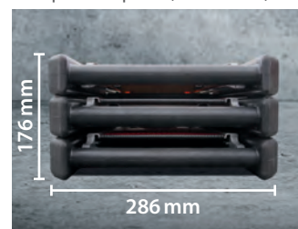
Platzsparend stapelbar (Frontansicht)